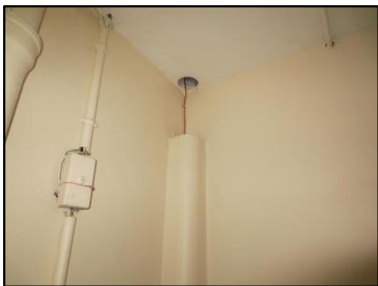
Photo N° 1144 AMIANTE CIMENT - -PALIERS RDC à +4 Gaines & coffres verticaux Fourreau