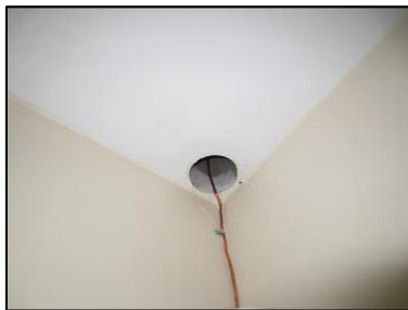
Photo N° 1145 AMIANTE CIMENT - -PALIERS RDC à +4 Plafonds Fourreau