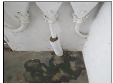
Photo N° 1148 AMIANTE CIMENT - -DEGAGEMENT -1 Gaines & coffres verticaux Fourreau